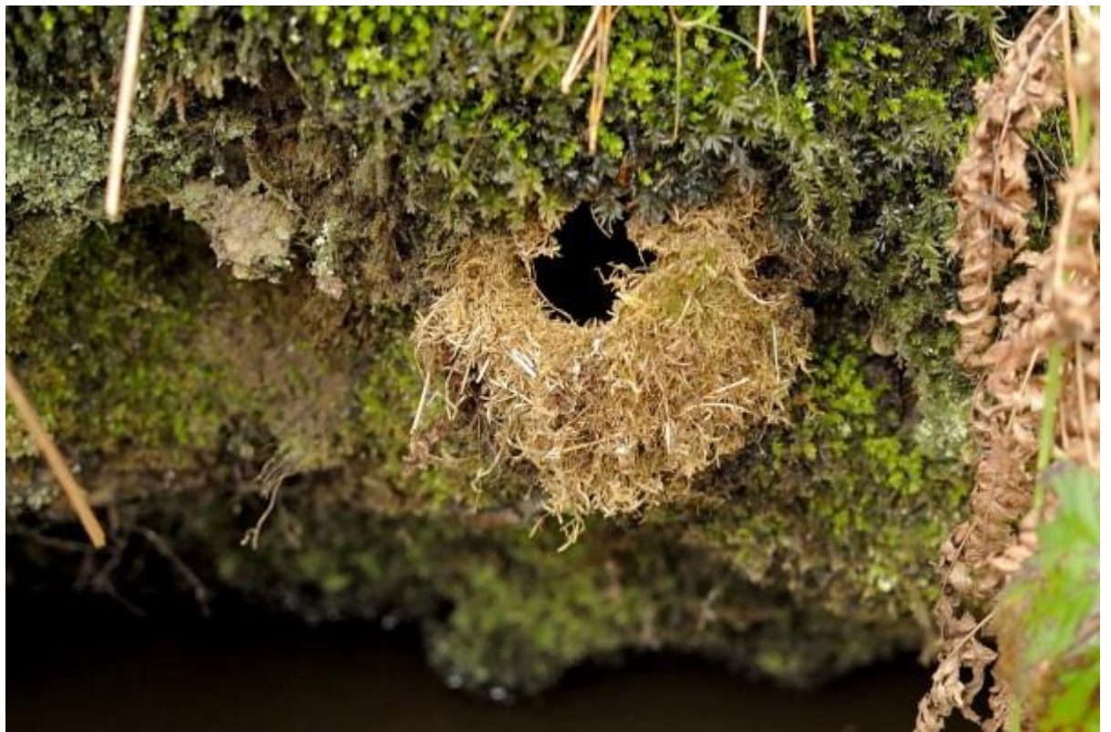
Nestje van een ijverige winterkoning